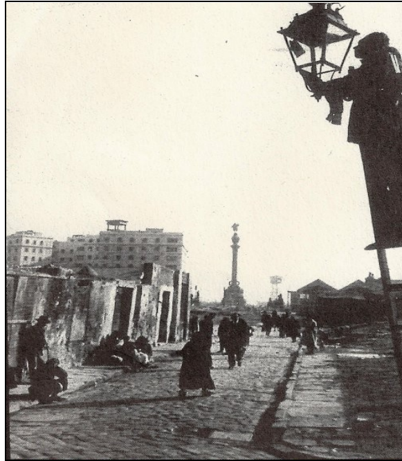
| Estat de la part baixa del carrer Migdia després de la guerra civil, on durant molts anys es van continuar veient les runes dels bombardeigs. Foto: Josep Postius (1953). Font: Paco Villar, "La construcció fotogràfica del Barri Xino", a l' Avenç nº306, octubre de 2005.

quinze i setze anys- i delimiten el famós Barri Xino . Si la pràctica de la prostitució a la zona venia d'antic, les condicions de misèria de la postguerra no van fer més que reforçar-la. Altrament, i tornant a l'any 1939, la croada contra els "delictes contra la moralitat pública" que va arrossegar a les prostitutes va incloure així mateix l'empresonament d'un grup important d'artistes i "tanguistes" -vint-i-set-, gent del món de la revista vinculada també a la zona del Xino , segons que hom pot deduir dels domicilis registrats.