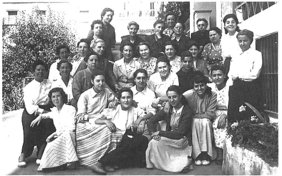
Al convent de les adoratrius s'hi celebraven exercicis espirituals, cursos, reunions i jornades.

L'«operació casa» és llarga i laboriosa. L'assumpte té prou importància per dedicar-hi tota l'atenció i hi intervenen els arquitectes Leopoldo Arnaiz i Francesc Ragolta. L'any 1987 resulta decisiu per aquest afer. El mes de juny es fan preparatius per allotjar la comunitat mentre durin les obres. Deu religioses podran viure en una casa del carrer Santa Eugènia, propietat del Bisbat. Altres quatre residiran en un pis, propietat de la comunitat, situat en una casa del mateix carrer Pare Claret, edificada en un solar que havia format part del pati del convent. Tres religio-