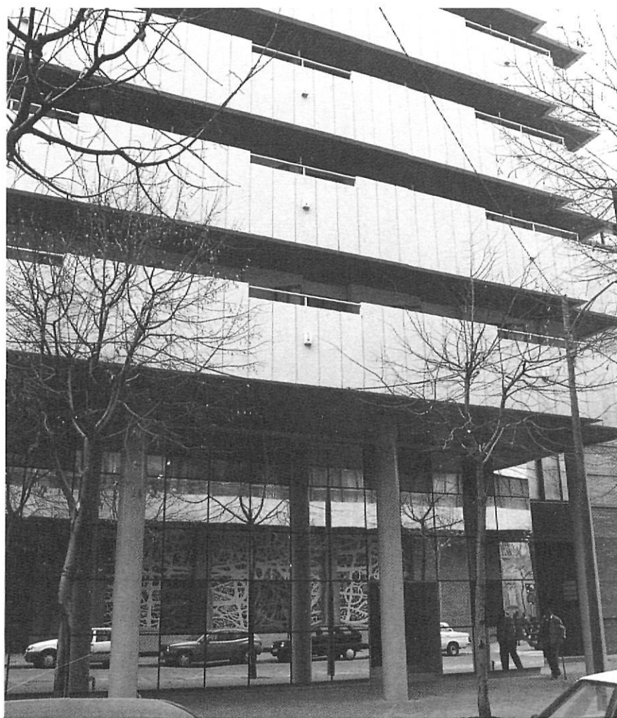
La nova casa de les adoratrius, en el mateix solar del convent enderrocat.

l'alcaldia comunica a la superiora que hauran d'allotjar 400 soldats que estan a punt d'arribar a la ciutat. Les monges protesten vivament i quan arriben els oficials per fer-se càrrec dels locals, es deixen convèncer sense massa dificultat que aquell no és el lloc adequat per allotjar els seus soldats. Per solucionar-ho, i d'acord amb el prelat, la tropa s'instal·la al temple de Sant Lluc, que encara no havia estat reconciliat per retornar-lo al culte.