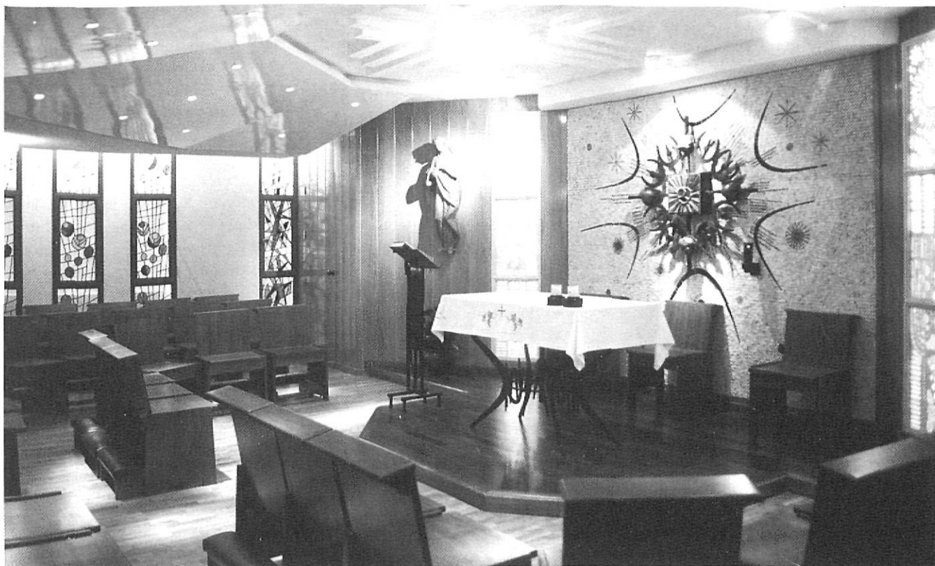
La capella del convent actual.

Després d'una pila d'anys d'intensa activitat en totes les dedicacions que són peculiars de la institució, a la comunitat d'adoratrius de Girona se li planteja una nova problemàtica: l'emplaçament del convent es veu afectat per un nou pla urbanístic. En realitat la presència d'aquell gran edifi-