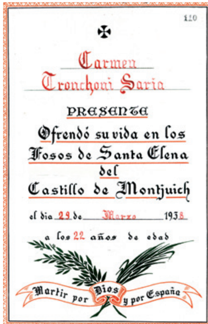
Referència a Carmen al Llibre dels Màrtirs del castell de Montjuïc