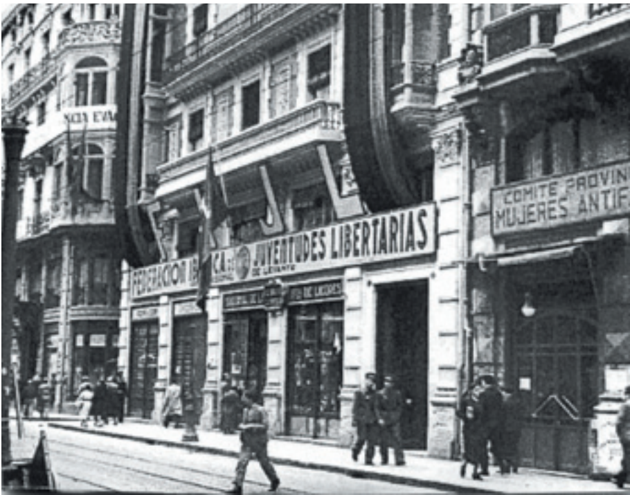
Anys 1937. València, capital de la II República. Carrer de la Pau.

continuaven amb els seus espectacles fins ben entrada la nit, sota el tronar de les bombes. Era el que la premsa de Madrid anomenava "el Levante Feliz".