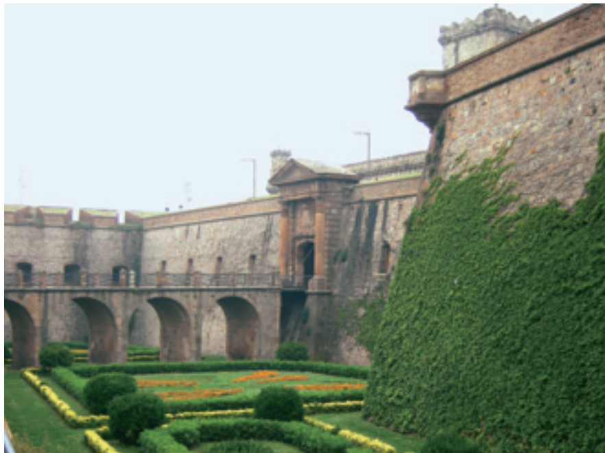
Entrada al castell de Montjuïc