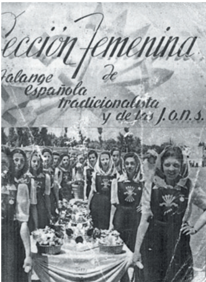
Revista de la Secció Femenina de la Falange