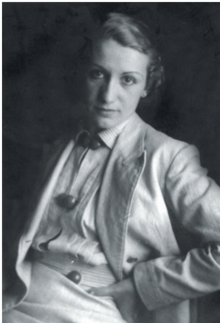
Primavera de 1936