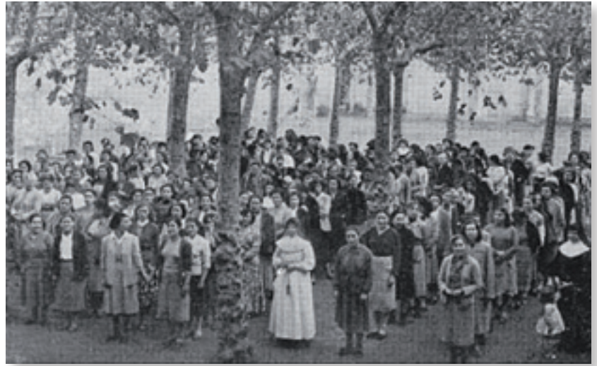
Grup de preses al pati de la presó de Les Corts