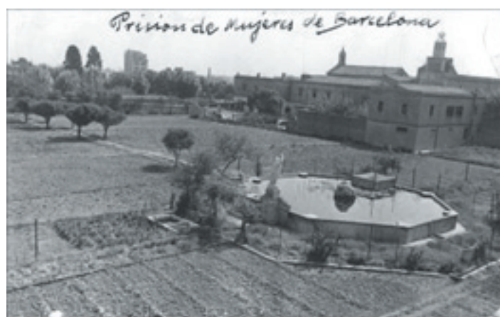
Presó de Les Corts a Barcelona.