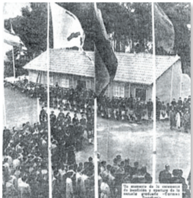
Cerimònia d'obertura de l'escola graduada "Carmen Tronchoni" a Montjuïc. Any 1940