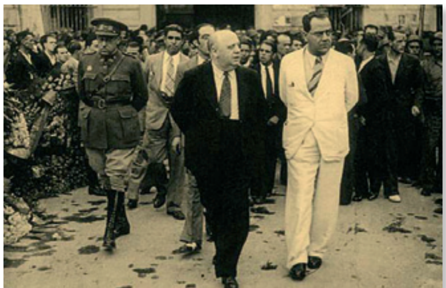
Juan Negrín (de blanc), Indalecio Prieto i el general Vicente Rojo