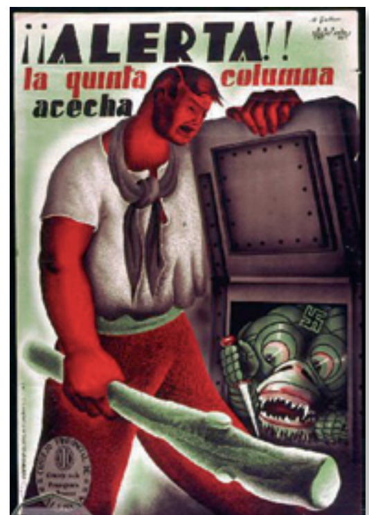
Cartell republicà en què s'alerta de l'existència de la Cinquena Columna